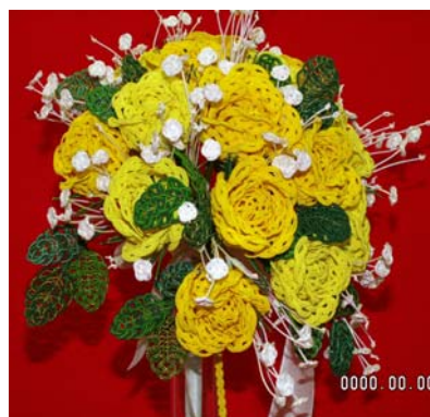
オリジナル水引ブライダルブーケ 和装・洋装に合わせてお作り致します。