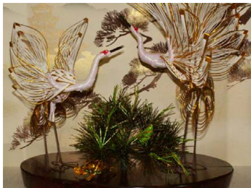
工芸品を結納記念の品として (夫婦鶴 ガラスケース入り)